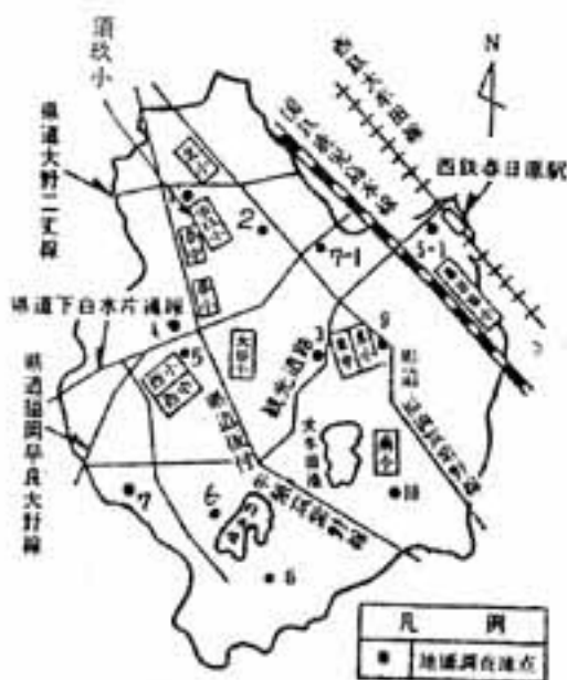
凡 例 ● 地価調査地点

身体障害者の方で結婚を希望される人は、春日市身体障害者福祉協会又は身体障害者相談員を通じて至急申し込んで下さい。