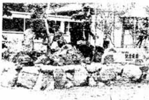
(写真) 見事な岩石庭園のとフジ園

春日小学校は明治35年2月、春日・日佐両村組合学校が解散したあと現在地に新築され、10月15日に開校。同37年4月春日尋常高等小学校と改称。昭和年代には町の発展に伴い、春日北小学校が34年4月に、また春日西小学校が45年4月にいずれも分離独立しました。 春日小の教育目標は「ゆたかな人間性とたくましい実践力をもつ子どもの育成」に置き、現在の児童数は22学級84人、現校長は21代目卒業生数は7千人余。