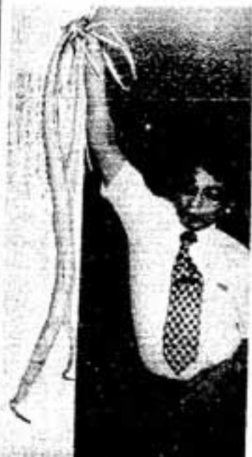
写真 これが「へびひょうたん」

ンスを考え、国民の皆さんの合意と理解を得ながら、制度が健全に運営されるよう国家的な努力が続けられなければなりません。