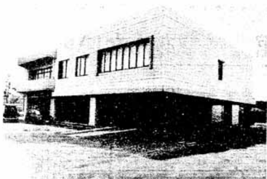
完成した文化会館（玄関前より望む）