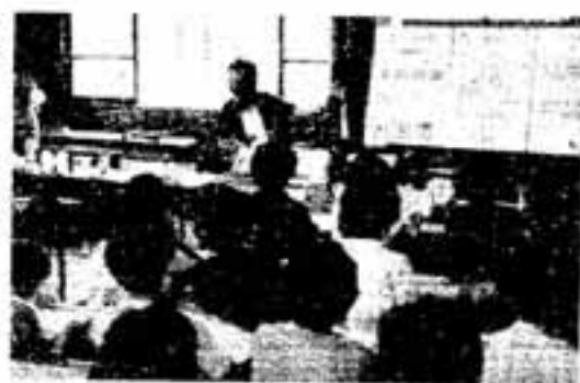
児童・生徒の心配ごと相談

お子さんのことで心配したり、困っているお父さん、お母さんがありましたら、どんなことでも遠慮なくご相談ください。 学校生活のこと、学習のこと、遊びや友だち、異性、クラブや部活動のこと、進学・将来のことなど、秘密は固く守ります。 (一週) 5733 教育庁福岡出張所 児童・生徒指導相談員