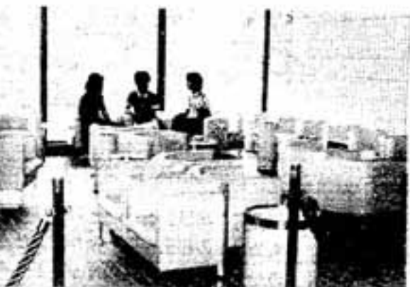
くつろげる1階のロビー

文化会館は鉄筋2階建て。延べ面積2千57平方メートルに300席の小ホール、400人収容の大会議室、防音装置付きの音楽室及び視聴覚室などのほか老人集會室、料理講習室、保育室、児童室と会議室3、学習室2、実習室があり、付設の陶芸室を含め総事業費は6億9千余万円です。