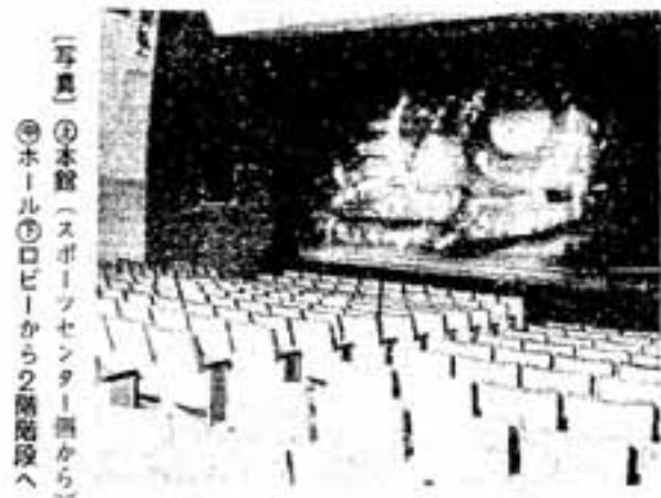
(写真) ①本館(スポーツセンター側から) ②ホール ③ロビーから2階階段へ