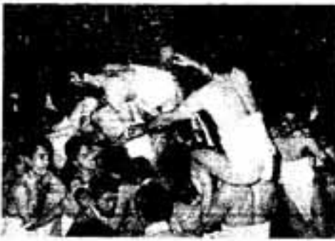
婿押しのハイライト・樽せり

点火と同時に笛で祝斗(のし)出し、花婿のあいさつ、花嫁と花婿の五、つづいて青年と子供たちの樽の奪い合い。宿の行事が終れば一回樽となり、真昼前で神官のお祓いをうけ、神楽を舞台に勇しい「樽せり」が始まり、奪い取った樽の一片を神棚に供え、五穀豊稔と開運を祈願する。樽せりが終わると、春日川(午願川)へ沙井取り