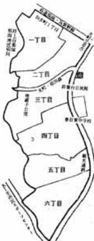
「若葉台西」新町名図

丁目」「若葉台西二丁目」次いで、市道「光町・原田線」を挟んで南側が同三丁目、以下南へ、順に四丁目、五丁目、六丁目となっています。 地元では、700世帯が家毎に真新しい住居表示板の取り付け作業を終わりましたが、進む「新しい町づくり」に船