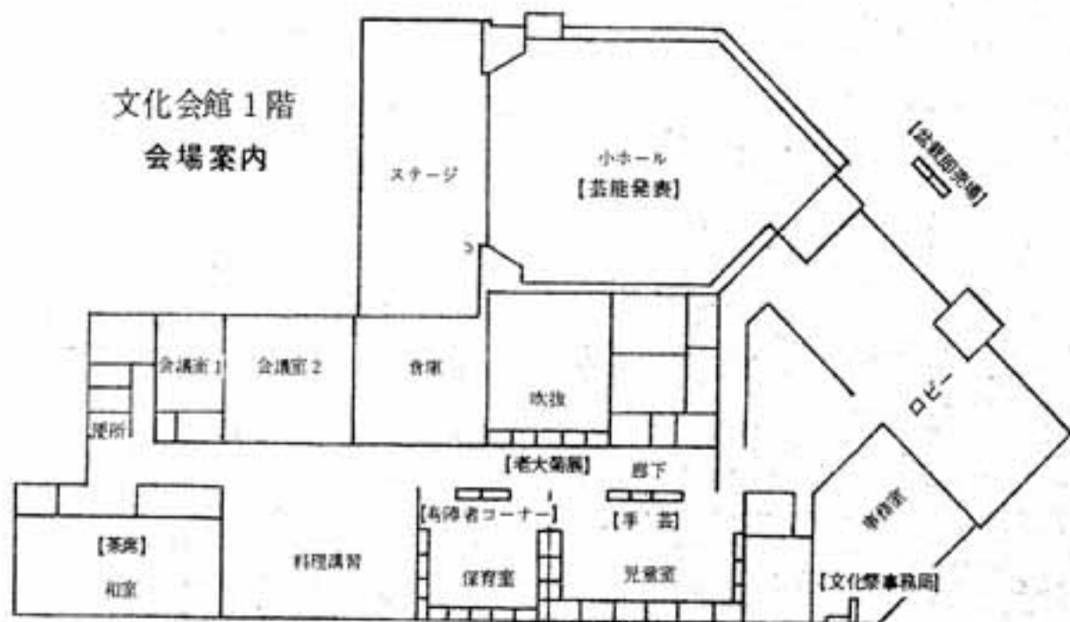
文化会館1階 会場案内

第10回春日市文化祭は11月2日(水)から4日(金)まで、文化の日を中心に3日間開かれ、菊花とかおりを競います。文化会館を中心にした展示会場もゆったり広がりました。勤労青少年ホームと体育館で5会場が得られ、ゆとりができました。