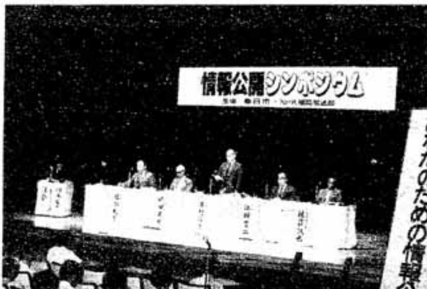
市民のための情報公開

あなたのための情報公開——と銘をうって春日市・NHK共催の「情報公開シンポジウム」が7月26日、市文化会館小ホールで開催されました。