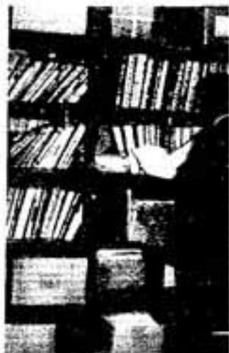
文書類の分類、整理で書庫も多忙