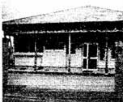
(写真)平田台下(塚原台)の西農会所