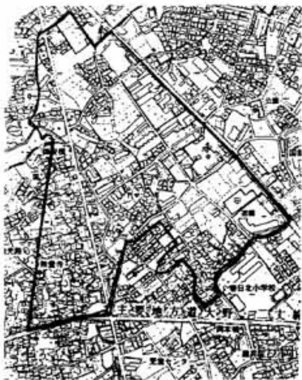
須玖北地区供用開始区域

水洗化改修工事についてご質問がございましたら、建設部下水道課(2階)11331か「春日市排水設備指定工事店」までお問い合わせください。