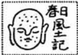
春日風土記 須玖の社 須玖小学校から110年(その三)

公開対象の情報とは 電子情報処理システムの入力 公開の対象になる情報は、「物」と定義し、「保管者は、 第二条で「市の執行機関が作成所持、保管する情報の目録簿 製、取得した文書、図画、写」を所定の場所で一般に閲覧さ 真、フィルム、磁気テープ、せねばならない」(第四条)