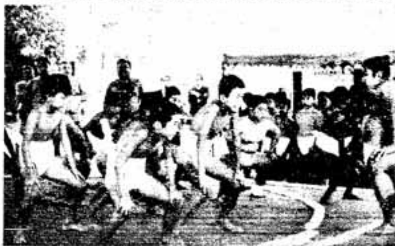
「しこ」の踏み方も教わりました