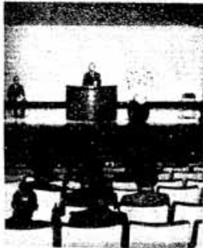
池谷市長代理・三村助役の来賓あいさつ