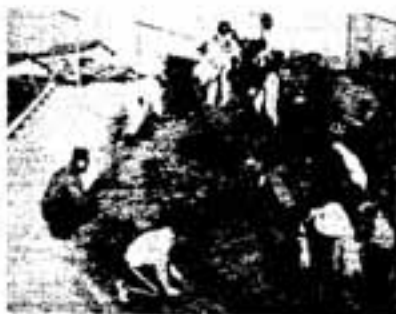
惣利公園での除草奉仕作業

ことが自慢のひとつでしょう。具体的には、地区の大運動会も本年は第13回を数え、また地区まつりとしての盆おどり大会も春日市民まつりより1年先整で第9