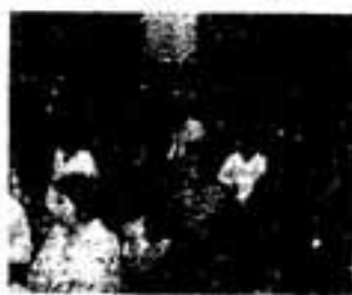
紅葉懇話会の講話に聴き入る

係で一流の講師をそろ えています。懇話会は 会員制ですが家族のほ か区民も話が聴け、年 2回レクリエーション も催されます。