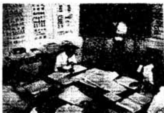
庁内各課の集例ヒヤリング