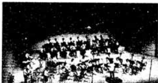
写真1 春日市民吹奏楽団の演奏

春日市民吹奏楽団は創立7年目を迎え、成人式などに出演し、文化祭・定期演奏会などの活動を通して「市民バンド」の名で親しまれています。