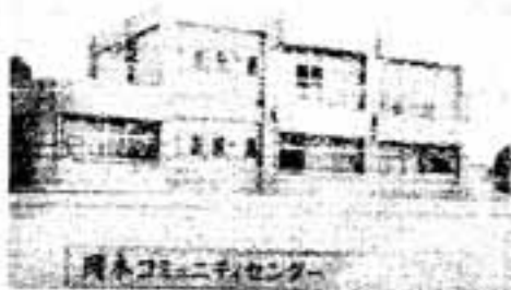
岡本コミュニティーセンター