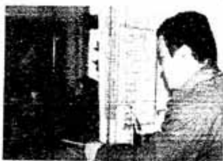
「3番です」くじを差し出す声もはび

を目標して、各チームの申し込みが1カ月前人以上も集まるので、同センターはくじ引きを考えました。菓子の空