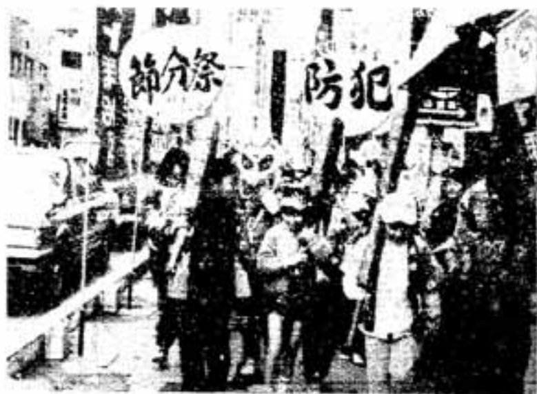
手づくりのオニ面をつけ繰り出す豆まき隊