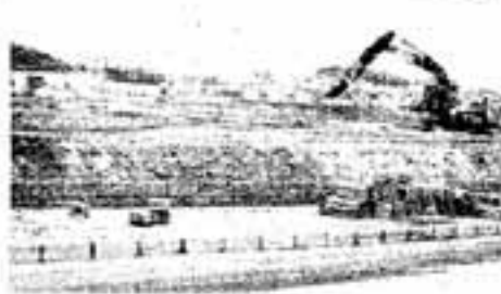
（写真）春日市同区画整理組合（遺棄は地利地）

春日市春日土地画整理組合は同組合保留地（24区画）を、公開抽選により売却します。面積は18平方メートルから60平方メートル。価格は1千40万円から3千400万円まで。