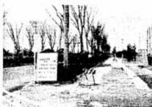
緑モールの植込み作業

にアケビなどのつるものも加えた40種類を選定しました。自転車道と遊歩道はX形にうまく交差させ、樹陰のあちこちにベンチを設けるなど、ゆとりと安らぎの場所にした。3月末完工を目ざして植栽作業を急いでいます。 その他の緑化計画では、国鉄鹿児島本線沿いの春日原・下大井線にはイチヨウ、また春日・春日原線はホルトの木を植えて緑の並木づくりをし