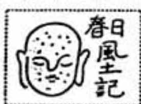
小倉の社 ② 住吉神社(その2)

○第47回自由美術展 2月28日(火) 13月4日(日)東京展作品など40点、 無料。