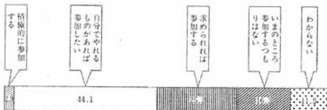
市に対する意見・要望の伝達は？

これからのまちづくりには市民の積極的な参加が望まれますが「積極的に参加する」という人は2・9%と非常に少ない。しかし「自分でやれるものがあれば参加したい」という人は44・1%と半数近くあり、さらに「求められれば参加する」と消極的ながらも参加意向を持つ人が25・2%と総じて市民のまちづくりへの参加意向は高いものとなっています。