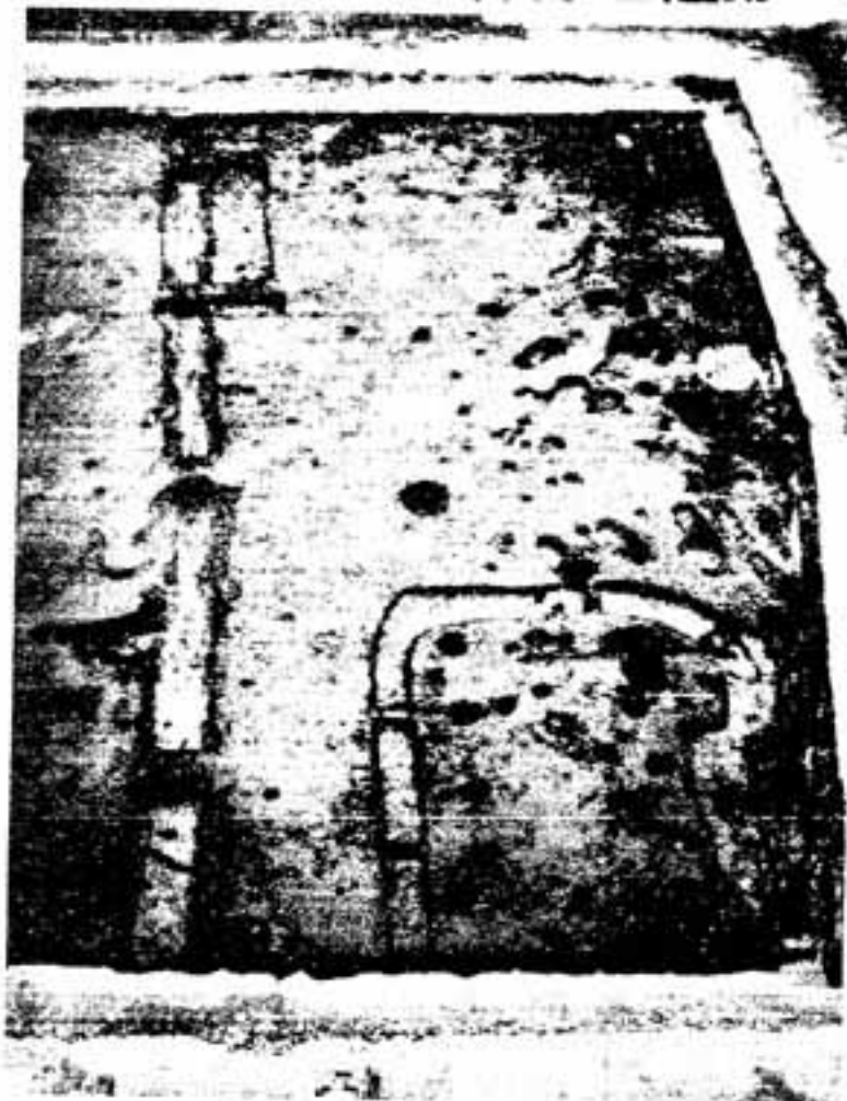
調査された須玖永田遺跡の全景

今年の6月から7月にかけて春日市教育委員会が調査をした日の出町6丁目の須玖永田（すくえいだ）遺跡から、邪馬台国のあった時代（弥生時代3世紀前半）の青銅器工房跡が発見されました。発見された青銅器鑄型、取瓶、中子、銅滓（銅くず）などから工房では銅鏡、銅鏡などの青銅器が作られたことがわかりました。須玖永田遺跡は須玖岡本遺跡群の中で青銅器生産を中心とする遺跡で、日本で初めて発見された銅鏡の鑄型は奴国（まのくに）の勢力の大きさと、また奴国の中心地であったことを物語っています。