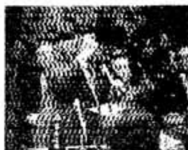
みだれたテレビ画面