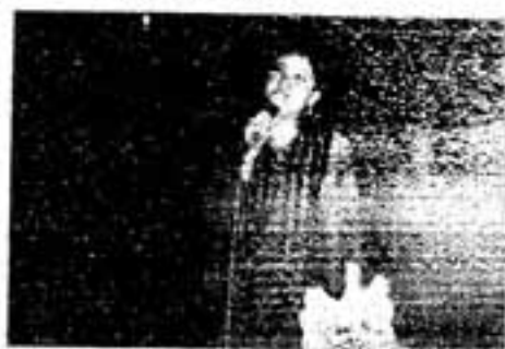
熱唱するジャネット・パスコ