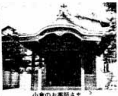
小倉のお薬師さま

お堂の中に標札が一枚残されています。薄く汚れた標札には、明治十四年(一七〇四)創立と記されています。宝永元年(一七〇四)創立と記されています。宝永元年(一七〇四)創立と記されています。宝永元年(一七〇四)創立と記されています。