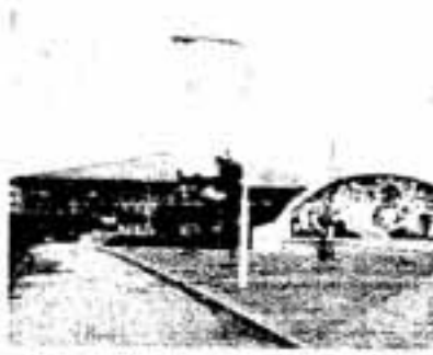
食堂、喫茶室もある職員・学生の憩いの場

とこれらのシステム化が重要な課題なので材料開発、分子、エネルギー交換の3工学と情