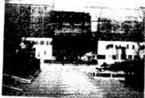
完成近い春日公園共同利用施設