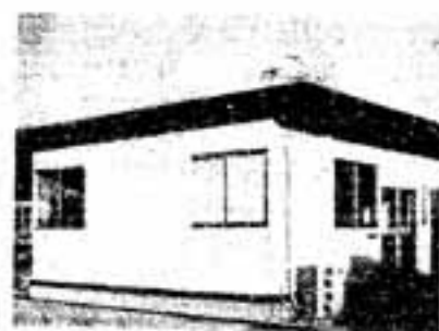
春日市高齢者事業団の新事務所