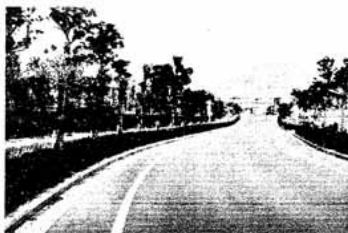
県営春日公園北側を望む

昼間できないところは夜間に、それも9時ごろで打ち切り、みなさんの睡眠を妨げないよう注意しています。下水道は20年計画で、まちをよくするための工事ですからご辛抱、ご協力をお願いします。