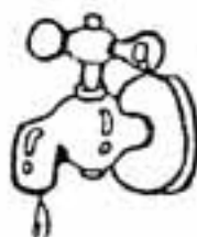
水道管にも冬はなくさ

夜の冷え込みが厳しくなる、水道管内の水が凍結し水道管が破損するおそれがあります。破損事故が起こるのには、寒さに対する保護をしていない露出配管が大部分です。