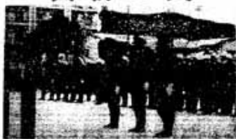
警の中での出初め式