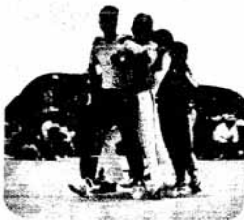
イッチニ、イッチニ ゴールへまっしぐら