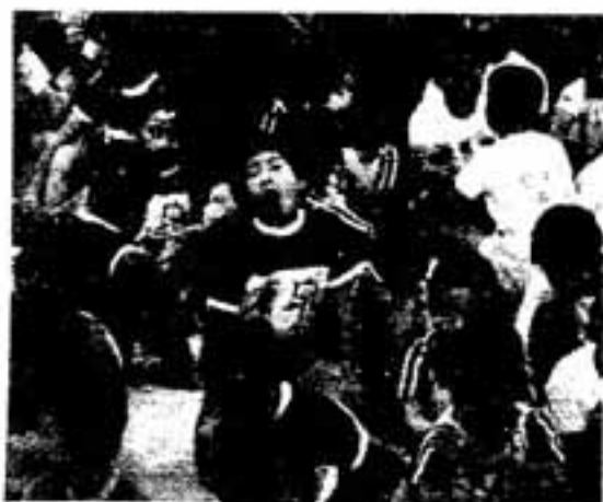
あーあ、まだかいなあー!