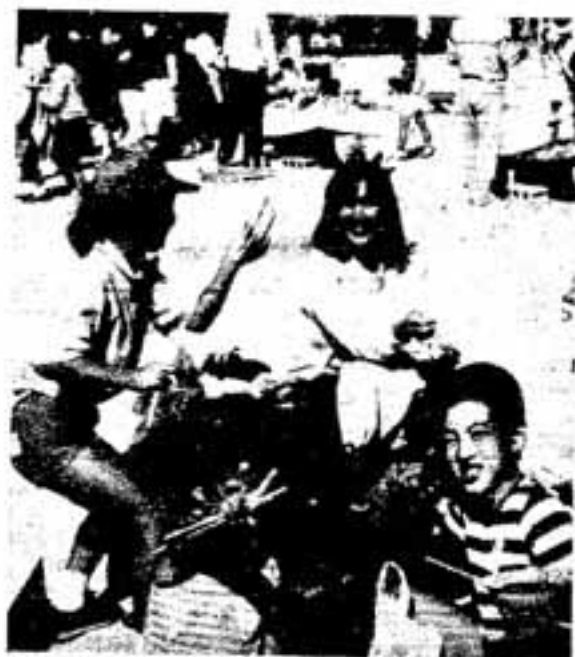
大人も子どももおよろこび

これは、同区の子ども会育成会の主催で、当日は小中学生を中心に350人が集まり、準備された80kgの肉は、あっといふ間になくなる盛況ぶりでした。