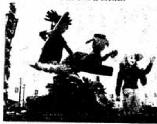
市中パレード 子どもに人気の花自動車