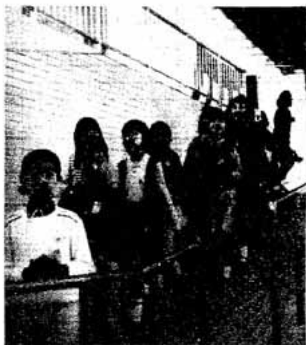
よろこんで渡るこどもたち (4月11日 地下道開通式典)

るために企画したものです。昭和四十六年創立以来、毎年各地で公演されていいますが筑紫地区で行われるのは、今回がはじめてです。春日市・春日市教育委員会も主催者となっています。 ◇ 入場料 指定席二八〇〇円 自由席一四〇〇円 ◇ 入場券の発売 春日市教育委員会社会教育課・中央公民館・文化会館で発売中。※数に制限がありますのでお早めに。