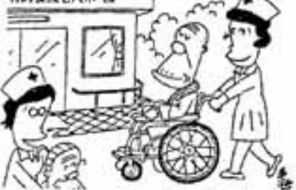
特別養護老人ホーム