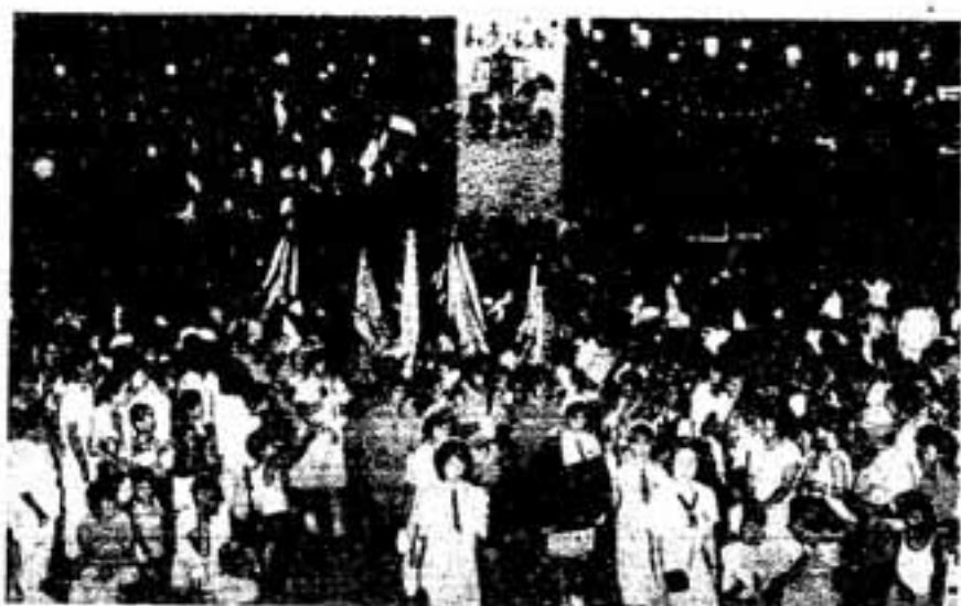
春日市ボーイ、ガールスカウトによる セレモニーで春日の火を迎えて。