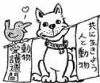
動物愛護週間 (9月20日～28日)

「婦人の翼」実行委員会では、アメリカ・カナダへの海外研修を実施します。 期間 11月16日(月)～27日(金) 応募資格 (1) 県内に住んでいる28歳から60歳までの女性。 (2) 健康で協調性のある人。 (3) 婦人問題に関する活動