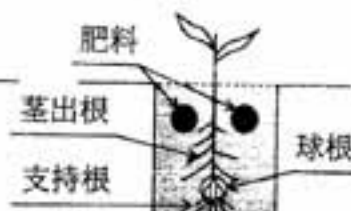
③穴を掘って肥料を入れ土を被せる