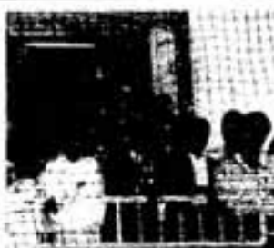
票の行方は？ 開票を見守る投票者 4/25