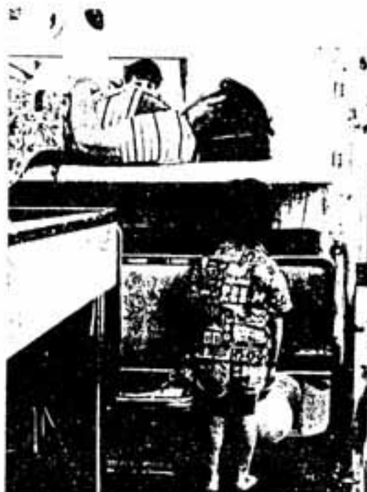
「そんなお母さん 僕好きだよ」

「自分だけは絶対にがんにかからない」という保障はなにもありません。過信せず、毎年1回は必ず検診を受けるようにしましょう。