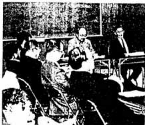
熱論をかす推進委員

市では、この答申を受けて具体的に改革を進めるためすでに「行政改革大綱」づくりに着手しています。