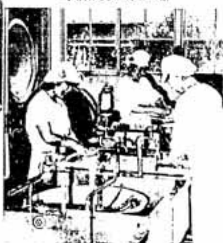
学校給食の調理風景

学校給食の民間委託については、調理員の欠員不補充の方式により計画的かつ段階的に民間に委託すべきであるとされています。また、新設される小学校については、当初から公設民営（施設は市で設置し、調理部門を民間に委託）とされています。