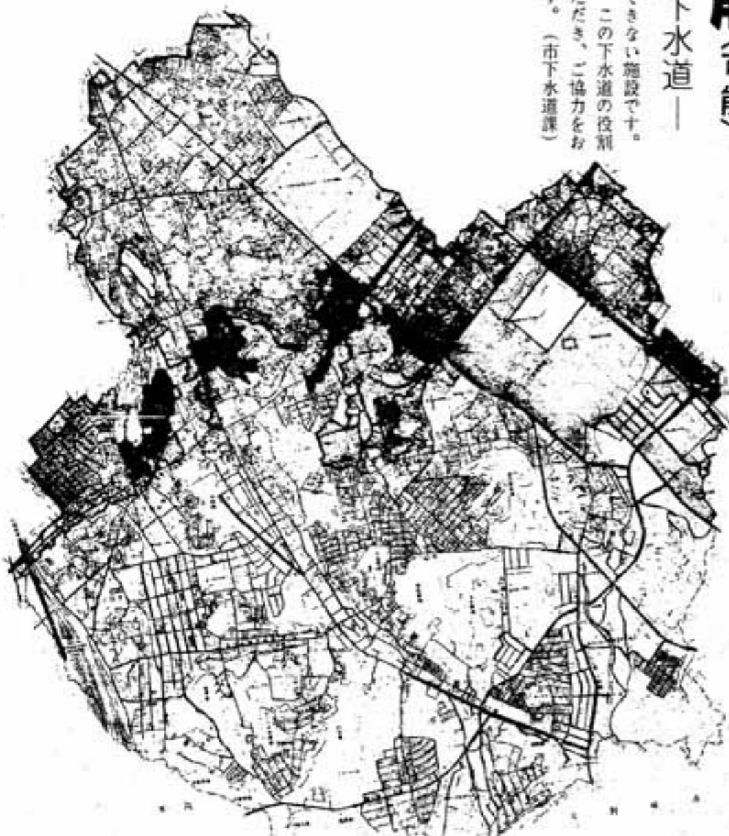
下水道の整備状況

くことのできない施設です。今後、この下水道の役割を理解いただき、ご協力をお願いいたします。(市下水道課)