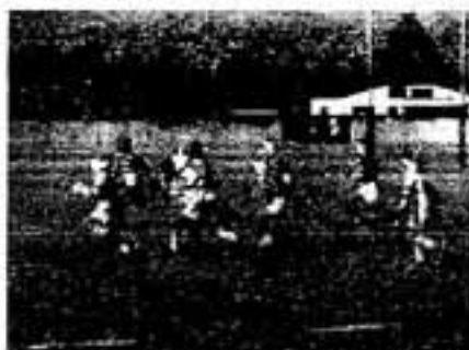
それいけ ゴールへまっしぐら

当クラブは、幼稚園児から中学生までを対象とし、ラグビーフットボールを通じ、心身のたんれん、責任感および協調性を養い、次の世代になう少年少女の健全育成にあたっていきます。