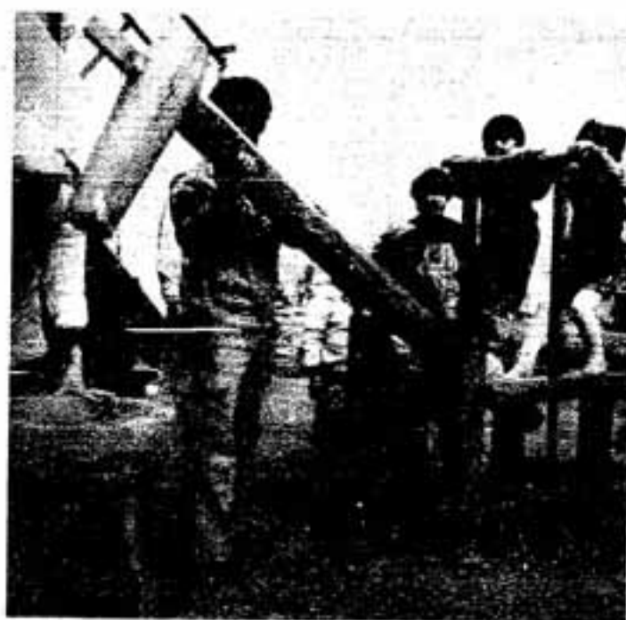
春日野中学校でもちつきする子どもたち

同中学校の建設企業体やPTA準備会の役員などが参加し行われ、つき上げたものは市の社会福祉協議会へ募金といっしょにプレゼントされました。