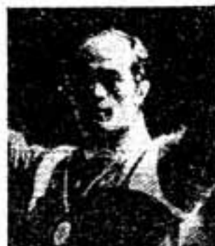
私がハンマー投げを始めた フオームを研究 ハミリカメラで

にわたってハンマー投げの日本記録を自ら更新し続け、アジア大会では前人未踏の5連覇を成し遂げられました。“鉄人”と呼ばれるその強じんな肉体と精神は、どのように培われてきたのか——お話を伺ってみました。