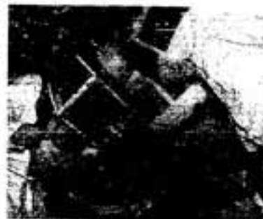
現地の人とともに