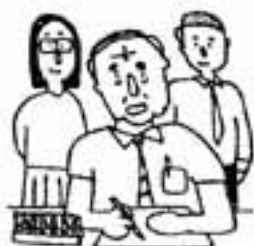
高齢者雇用促進月間