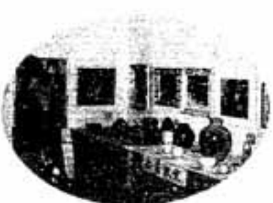
すばらしい展示品の数々