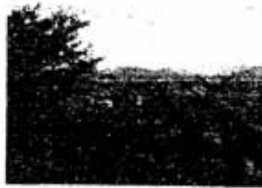
岡本の辻から見た風景

ツジというのは、山の頂きや高みのことをいいます。しかし、山だけでなく、木のツジ、畑のツジ、頭(かぶ)のツジなどという言葉もあります。また各地の農家で、屋根裏に設けた部屋とか、中二階以上の空間全体をツシとかツジなどといい、多くは物置場や養蚕用の部屋にしています。イロリの上に設けた火櫃(殺物などを干すための棚)もツシといえます。とにかく家屋内の高い所がツシ、ツジで、ツムリ、ツムジなどもツジの類語であり、