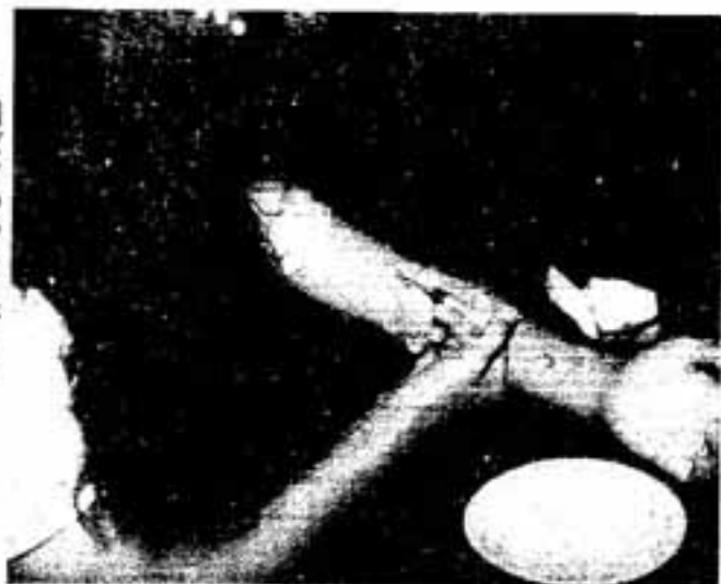
1回だけのつもりが……

覚せい剤の中毒になると、幻覚や妄想が現われるようになります。精神障害をきたします。シンナーの乱用から、覚せい剤の使用を始める例は多く、少年少女を覚せい剤から守るためにシンナーの使用には気を付けましょう。