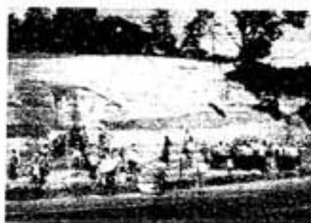
九州最古の瓦窯・ウトグチ遺跡