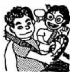
シートベルト着用推進運動 (8月1日～31日)