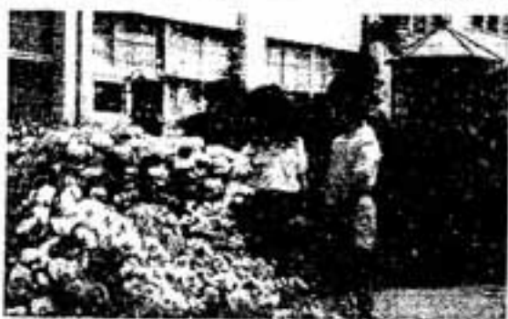
花いっぱい春日西小