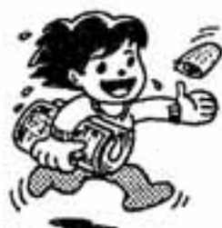
勤労青少年の日(7月16日)