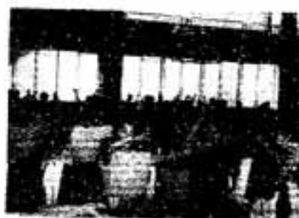
月日 そうよ 春日は若いまち 月日

今年も地区祭りなどで行われる踊りの指導者講習会を開きます。 ふるってご参加ください。