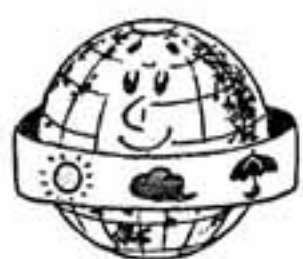
世界気象デー (3月23日)

期間 4月24日～7月3日 毎週日曜日 午前9時～10時30分 場所 市スポーツセンター 剣道場 対象 市内に住んでいる小学生以上の女子 受講料 無料(スポーツ傷害保険は自己負担) 用具 無料で貸します 募集人員 20人(定員になり次第締め切り)