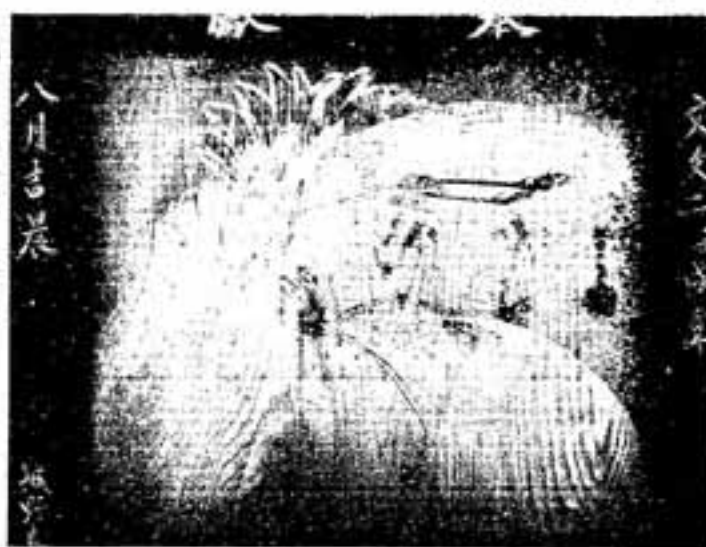
八月五日(尾形 探香画)

昭和五十一年の調査では、百二十一点の絵馬が確認され、その内の六十三点が昭和のもので、そのほとんどが戦後の子供会奉納のもので、