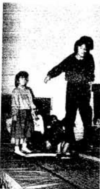
元気に遊ぶ子供たち

子供が成人病予備軍になりやすいかどうかを見分ける重要なバロメーターが肥満です。文部省の調査によると、小・中学生の肥満児童・生徒は、十二、三年前と比べて約二倍に増