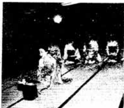
〈宿の行事（のしだし）〉