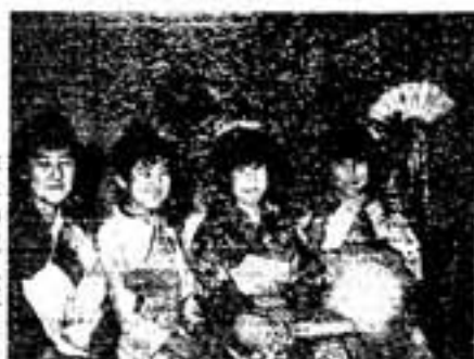
昨年の成人式より