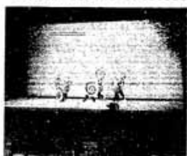
盛大に行われた発表会