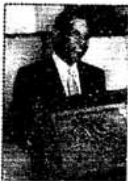
衣笠 祥雄 (きぬがさ・さちお) さん略歴

昭和二十二年一月十八日生まれ。四十年に私立平安高校卒業後、広島カープに入団。五十一年盗塁王。五十五年日本新となる千二百四十七試合連続出場を達成。五十八年通算二千本安打達成。五十九年最優秀選手(MVP)賞を受賞。昭和六十二