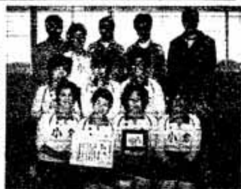
優勝した小倉公民館

昨年の11月に行われた、「第2回春日市ビーチバレーボール大会」で、小倉チームが前回に引き続き優勝の栄冠に輝きました。