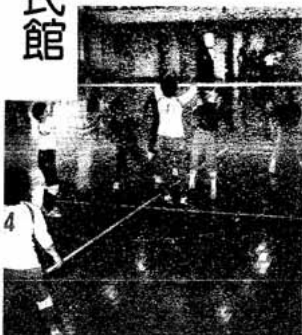
ナイスプレー続出の決勝戦