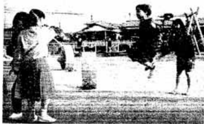
児童センターで遊ぶ子どもたち