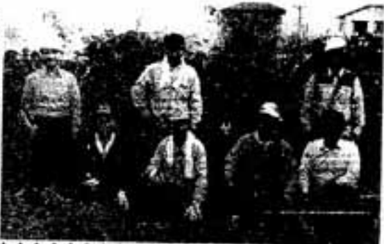
まだまだ若い緑友会の皆さん