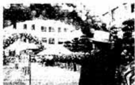
市役所前で行われた盛大な式典