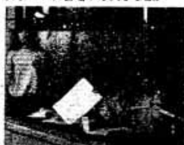
アナウンサーもボランティアが