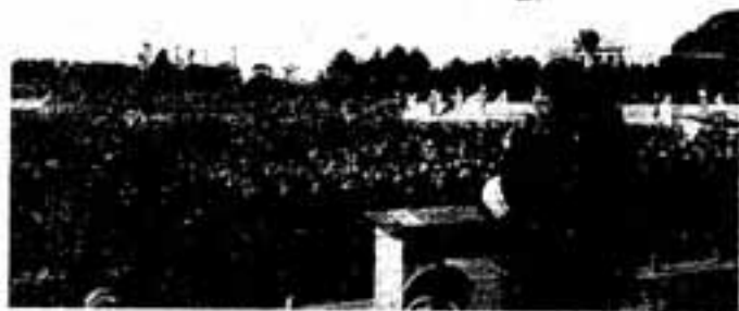
国体の成功に向けガンパロー