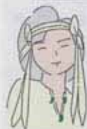
1もづくりイメージキャラクター お生ちゃん

総人口 88,649人 男 43,810人 女 44,839人 前月比 +165人 前年同月比 +2,725人 世帯数 30,742世帯 (11月1日現在)