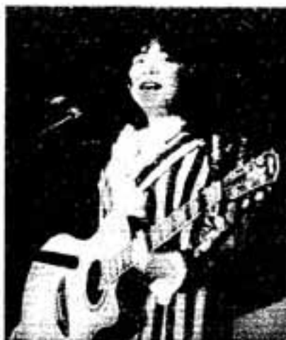
「弥生の里フェスタ」ではイルカも熱演