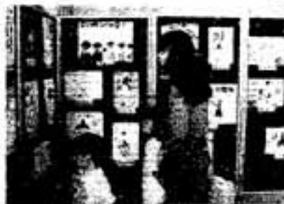
みんなじょうずに揃ってるね