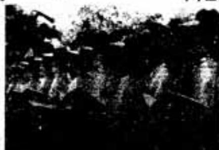
国体市民合唱団のさわやかなコーラス