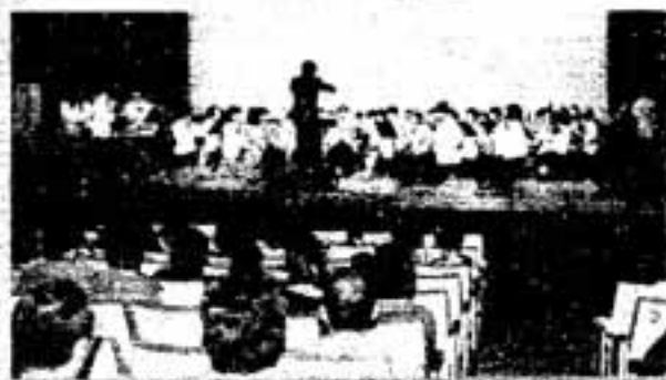
文化祭で記念演奏する市民バンド

県大会、九州大会を経て、九州からただ一つ全国大会に参加。当日は、課題曲として行進曲「マリンシテイ」、自由曲として「ダンス・セレステイアール」を演奏、メンバー65人のチームワークで見事銀賞を射止めました。