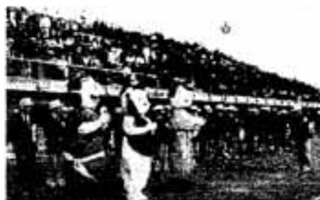
来年は石川国体でお会いしましょう