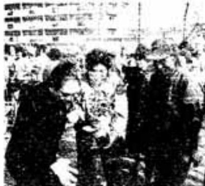
どれにしましょうか

思い思いの苗木を手にした皆さんは満足そうな表情。2年後、3年後には、かわいい実をつけ私たちの目を楽しませてくれることでしょう。