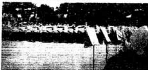
中学生プラスバンドの演奏に合わせて選手団入場