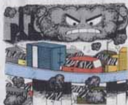
大気汚染防止推進月間

固定資産税) .....第4期 都市計画税) .....第4期 国民健康保険税.....第7期 国民年金保険料.....12月分 下水道受益者負担金...第4期 ※自主納付、納期内納付にご協力を