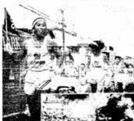
力走するリレー走者