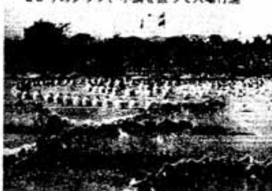
中学生のマスゲームに会場から大きな歓声