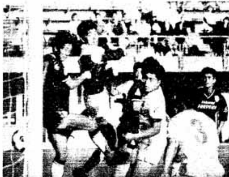
とびうめクラブの猛攻を必死に防ぐ長野県