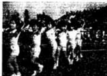
バラバルーン演技で選手を歓迎