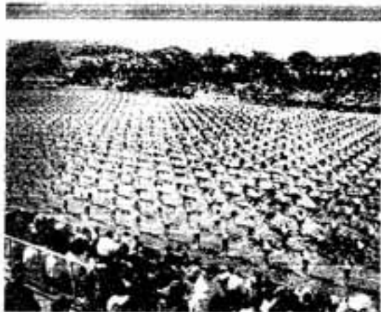
きれいにそろった小学生の棒体操