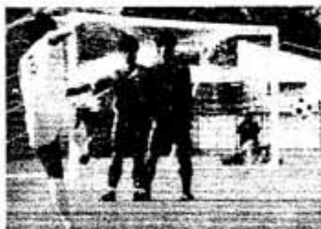
埼玉のフリーキックで決勝点が…(決勝戦)