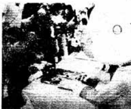
アンパンマンは子どもたちの人気のま