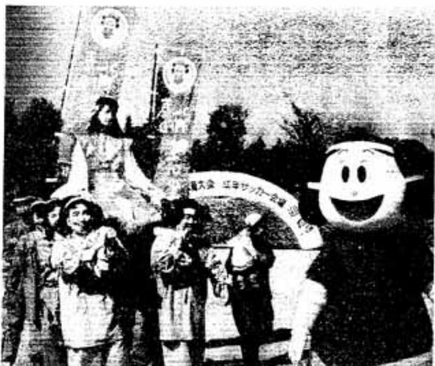
古代人の服装で弥生の里かすがをPR