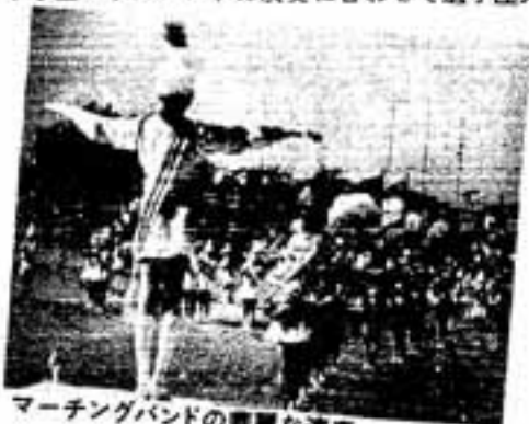
マーチングバンドの華麗な演奏