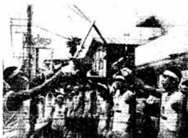
中継地で引き継がれる炬火