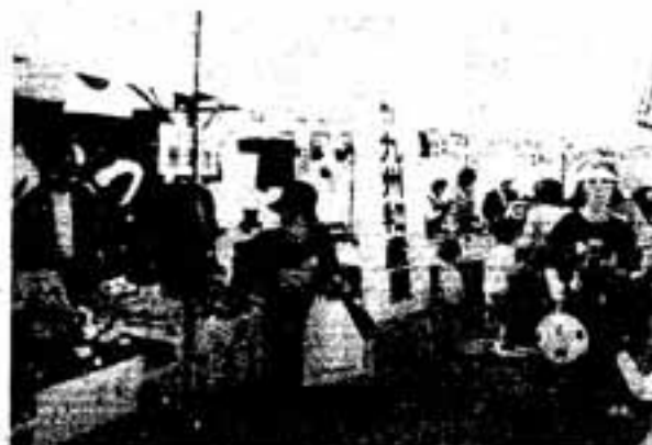
好評だった九州物産展

から盛大な式典が行われ、市長が「走者の皆さんに大きな拍手を送ります」とあいさつ。マーチングバンドの演奏や春日市舞踊連盟の踊りなどで国体の成功を誓いました。