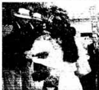
キャラバン隊に花束が