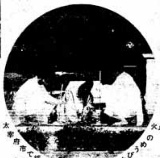
太宰府市で採火された「古都に旅する」とびうめの火