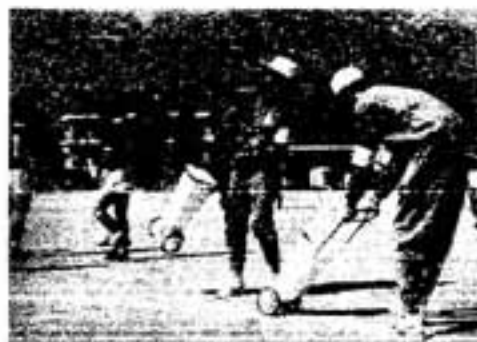
補助員として活躍する春日高校の生徒