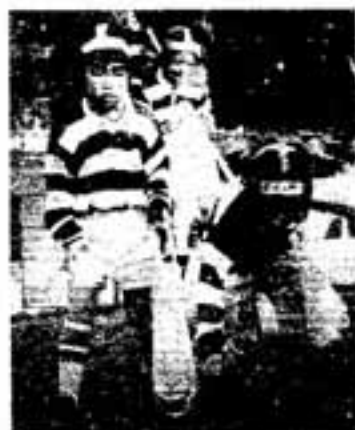
ここにもゴミがあったよ(クリーン作戦)