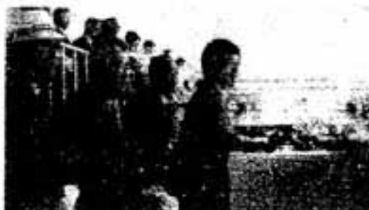
サッカー競技をご観戦になる高円宮殿下