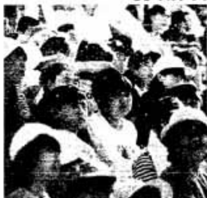
がんばれー とびうめクラブ