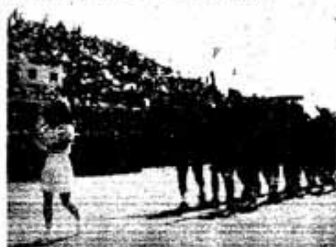
とびうめクラブ、小旗を振って入場行進