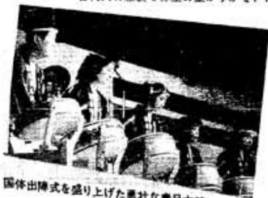
国体出陣式を盛り上げた勇壮な春日太鼓