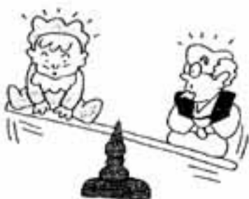
高齢化社会の実態を明らかに