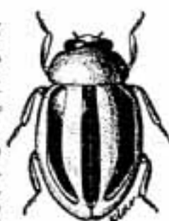
ミスジキイロテントウムシ

たのしい話題をたくさん取材したいと思います。今年はあるところへ取材にうかがうかもしれませんが、その時はよろしく。