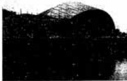
福岡県立総合プール