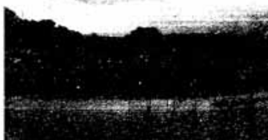
東平尾公園博多の森陸上競技場

参加費 無料 申込方法 希望者は氏名、年齢、性別、住所、電話番号、希望する日時を記入し、ハガキまたは電話で申し込む 申込先 春日市役所国体室内第45回国民体育大会春日市実行委員会(春日市大字下白水69の1) ☎(50) 1131 締め切り日 3月30日(金)17時(ハガキの場合も同日必着)