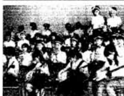
みんなの心がひとつになって

新駅からは、「こだま」の回 送列車が一日に上り18本、下 り14本の計32本が運行される 予定で、上り列車は、博多駅 で乗り換えることなく本州へ 行くことも可能です。また、 運賃は博多駅まで、片道普通 乗車料金100円に特別料金100円 を加えた200円となる予定です。