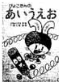
あいうえお びよこたんの あいうえお

伸行は、8年前に別れた阿沙子に偶然出会った。学生時代、映画にうつつをぬかしていた伸行は阿沙子の卒業用の柳田国男全集を売ってしまったのだ。甘くせつない心情を軽妙に描いた恋愛小説。