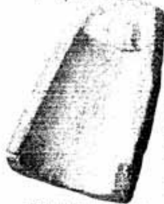
須玖坂本遺跡出土の銅鐸鋳型

形は約鐘状で、種類は20cm前後の小型のものから、1・5m前後の大型のものまである。両面に種々の文様、時に原始絵画を施し、祭器として用いられたと言われている。主に近畿地方を中心に出土している。