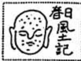
春日風土記 148 地蔵のよだれかけ

今回の調査で同遺跡からは、このほかに銅矛の「中子」10、6点、両面使用の勾玉鋳型1点、銅のくず25点のほか土器多数が出土しています。