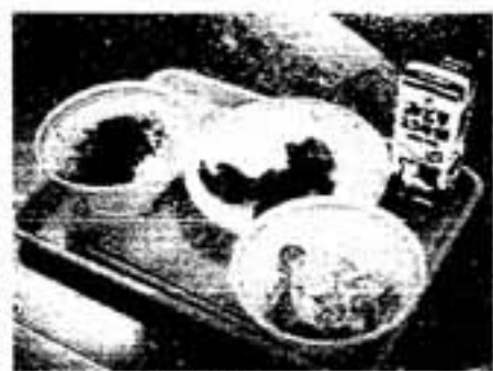
磁器食器に配膳された給食