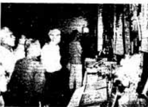
みことなであばえすね

府政庁跡まで移動し、そこから四王寺山登山にチャレンジ。7歳から80歳までの約1000人の参加者は、マイペースで頂上を目指しました。ほとんどの人は、休けいをとりながら、目的地の県民の森にたどりつきましたが中には、一気に頂上まで駆け登った子どももいました。