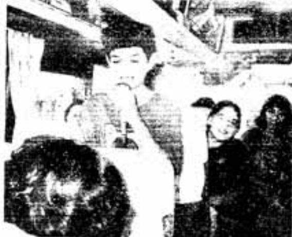
バスの中で楽しく交流