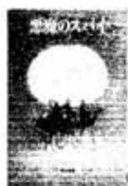
悪魔のスパイ マイケル・パー ゾウハー

第1次大戦のさなかの1917年、オスマン・トルコ軍はイギリス軍と激しい戦闘を続けていた。その中で美貌のユダヤ人女性ルースは、トルコ軍の機密をイギリス側に流していた。スパイ・サスペンス。