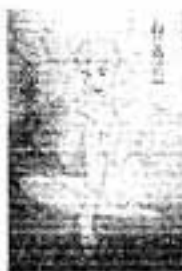
恋愛さがし ねじめ正一

第1次大戦のさなかの1917年、オスマン・トルコ軍はイギリス軍と激しい戦闘を続けていた。その中で美貌のユダヤ人女性ルースは、トルコ軍の機密をイギリス側に流していた。スパイ・サスペンス。