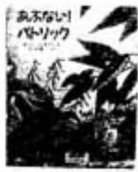
あぶないパトリック ポール・ジュラマイ

はじめて文字に目を向けた子どもに、無理なく、むだなく、面白く読め、自然に正しく書けるように組み立てられている。子どもと一緒に楽しみながら活用できるひらがな練習帳。