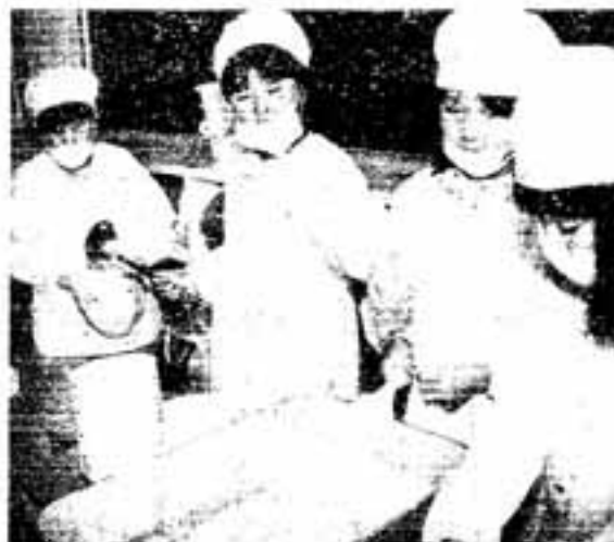
給食は生徒が交替で配膳

現在使われている磁器食器は、おわん二つと皿一枚で一組、耐性を高めた強化磁器と呼ばれる焼き物です。値段、重さもアルマイト製の約4倍になりますが、子どもたちに物を大切にすることを教えるという教育的効果も期待できます。磁器食器を市内全小