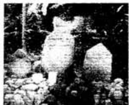
須玖氏宅の六地藏、よだれかけはとってある

もいにとらわれます。そこで、なんとか助けたいと思い、地蔵にすがったのです。地蔵は慈悲深いので、快く引き受けてくれますが、賽の河原にはたくさんの子どもがいます。その中で頼まれた子を見分けるのは困難です。