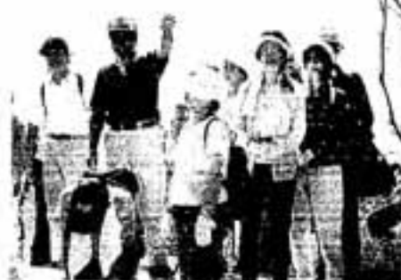
エー/あそこまで登るの