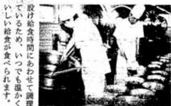
良質委託をした春日野小学校の調理場

春日小学校では、卵や牛乳などを食べるとアトピー性皮膚炎や気管支ぜんそくなどアレルギー性の症状がでる子どもに対する特別給食を、昭和59年から作っています。これは、卵アレルギーによる湿疹に悩む三年生男児の母親から、春日小学校の調理士が相談を受けたのがきっかけです。校長や担任、栄養士、調理士、保健婦などの理解と協力で実現しました。