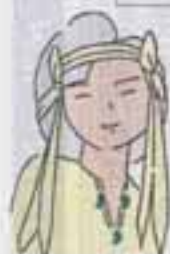
まちづくりイメージキャラクター 物生ちゃん

総人口 90,306人 男子 44,810人 女子 45,496人 前月比 +135人 前年同月比 +2,222人 世帯数 31,876世帯 (8月1日現在)