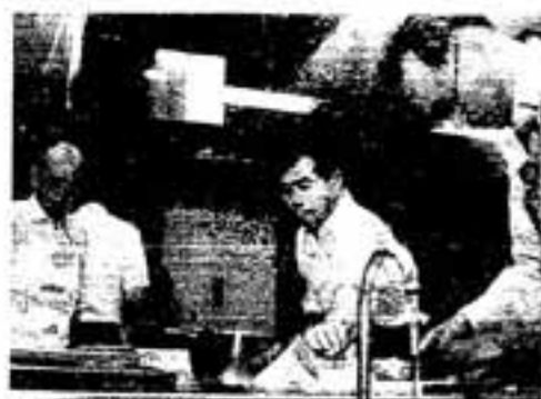
意外にうまい包丁さばき(文化会館・料理教室)