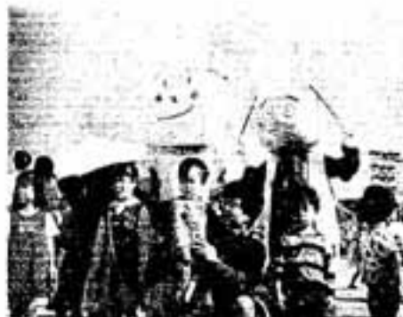
弥生の里フェスタ(昨年分)