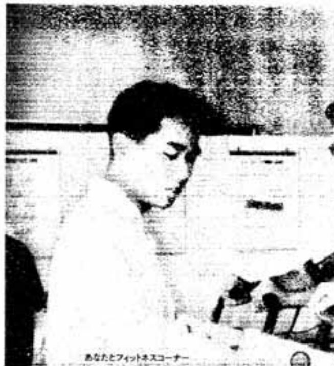
あなたとフィットネスコーナー

笑顔で歩こう 緑と湖の街並みを 「第1回かすが健康ウォーク」参加者募集 市と市健康づくり推進協議会 健康づくりの方法はいろいろでは、健康まつりにちなんで市 ありますが、中でも歩くことは民参加の「健康ウォーク」を開 最も日常的で取り組みやすく、安全で効果が高いすぐれた健康