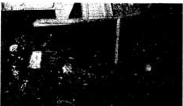
▽違法駐車止め出し(建設課)

秋の交通安全県民運動が9月21日から30日まで行われます。この運動は、県民一人ひとりに交通安全知識を普及し、交通安全思想を高めるとともに、正しい交通ルールの実践を習慣づけることにより、交通安全の徹底を図ることを目的とします。 重点目標 ▽若者による無謀運転の追放 ▽シートベルト、ヘルメットの正しい着用