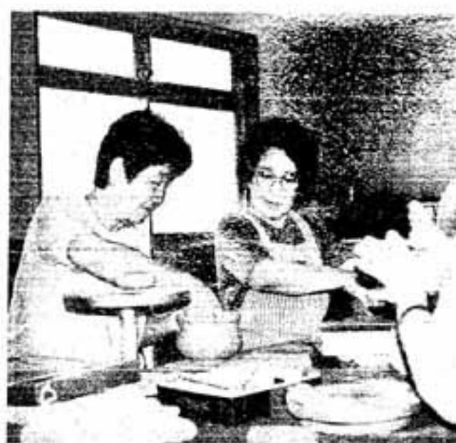
指先がコブがあるのかな(文化会館・陶芸教室)

このような流れのなかでは、新しい知識や技術を習得し、余暇を快適に過ごす能力を身につけることがますます大切になってきています。 充実感に満ちた楽しい余暇を作る能力は、ヒマになったからといって急に身に付くものではなく、基礎習得のための長い時間を必要とします。 自分の隠された天分を伸ばし、忘れていた才能を掘り起こし、新しい学習に挑戦してみませんか。