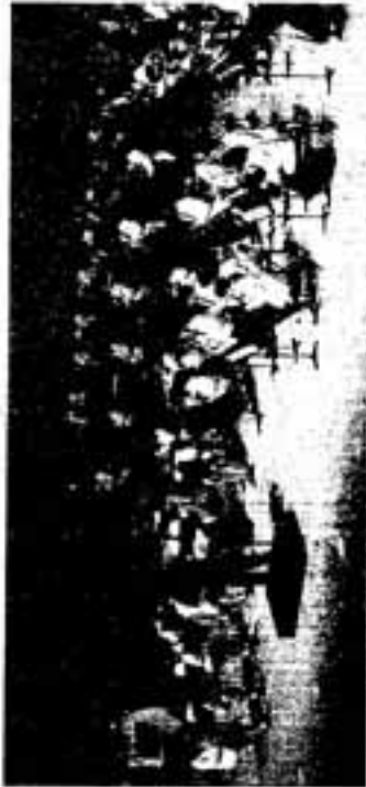
＜市民バンド演奏：スポーツセンター2F＞ ※今回はビッグアップルホールでの演奏になります。