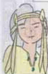
まちづくりイメージキャラクター 物生ちゃん

総人口 90,171人 男 44,701人 女 45,470人 前月比 +35人 前年同期比 +2,411人 世帯数 31,764世帯 (7月1日現在)