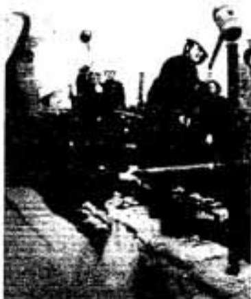
真剣な表情で土のうを固定

島原の雲仙岳噴火に伴う現地消防団員の死亡も伝えられるなか、各消防団員は緊張の面持ちで訓練に参加していました。