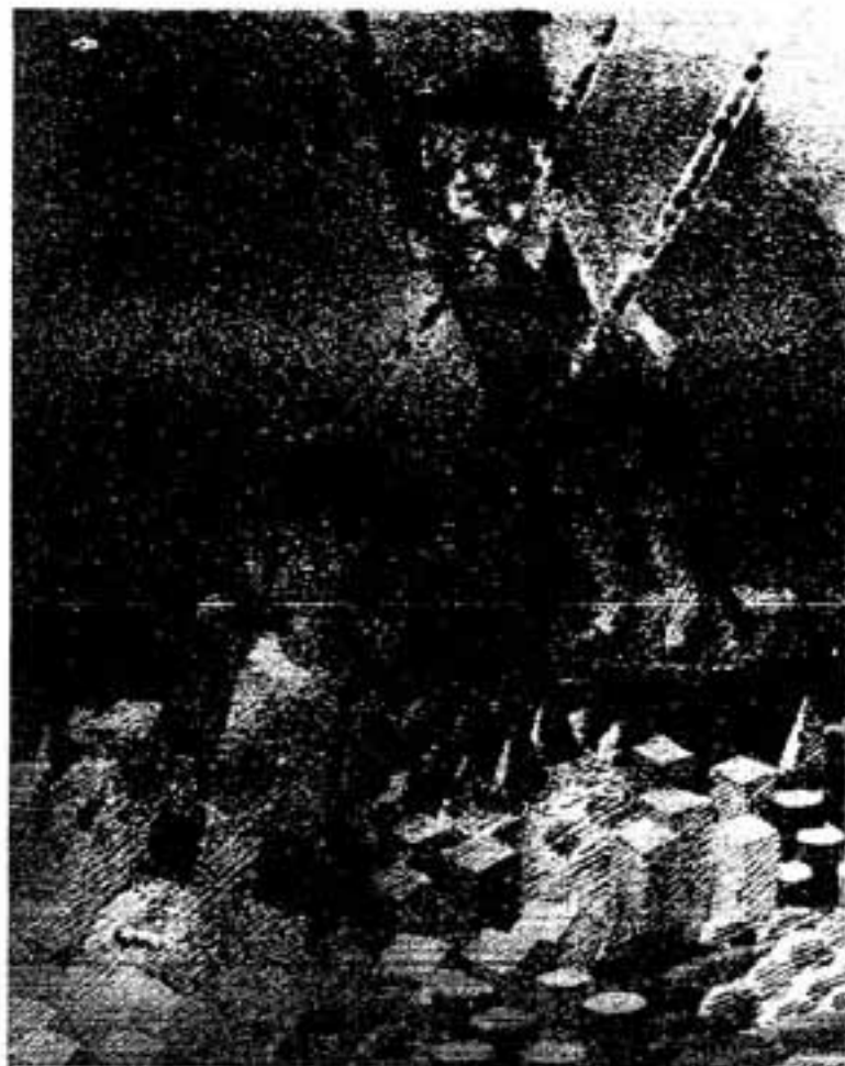
第3次総合計画書表紙から