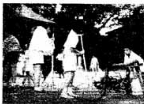
たくさん集まったわ