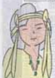
まちづくりイメージキャラクター 誕生ちゃん

総人口 90,136人 男 44,726人 女 45,410人 前月比 +234人 前年同月比 +2,376人 世帯数 31,758世帯 (6月1日現在)