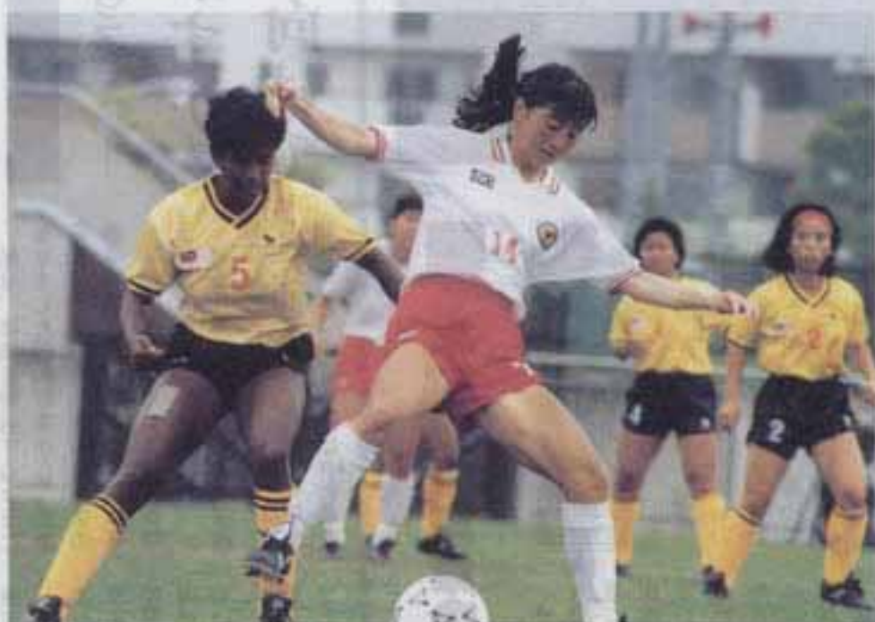
6月1日アジア女子サッカー日本対マレーシア戦(春日公園)