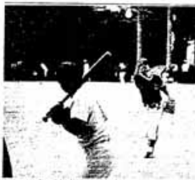
スローピッチは打ちにくいなあ

大会の結果は、次のとおりです。 優勝 大谷公民館 準優勝 惣利公民館 第3位 春日公民館 春日原公民館