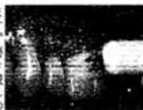
歯ブラシを歯に直角にあてて、軽 く歯ぐきを圧迫させながら、細か く歯垢を振動させるのがポイント。 毛先がほとんど動かない。

歯の表側(唇・頬にあたる側) は歯ブラシを歯に直角に当て横 方向へ振動させます。前歯の裏 側はかき出すように上下に磨き