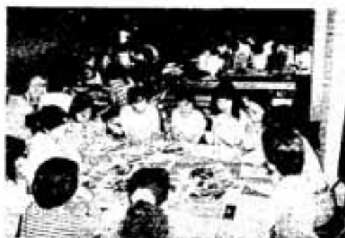
広報紙を作るのは意外とおもしろいわ

新聞づくりに必要な知識・写真の撮り方・見出しやレイアウトの注意など講師のユーモアをまじえた話に、約80人の参加者はなごやかな雰囲気の中で広報紙づくりのノウハウを学びました。