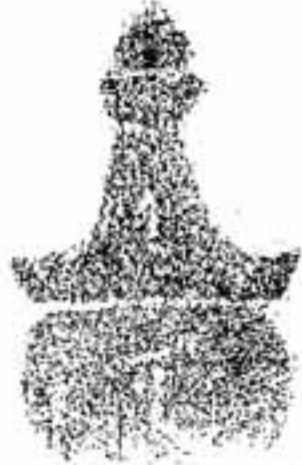
拓影「ウ」が読み取れる

筑紫地区では、九大前の東区地蔵松原に2例、太宰府市観世音寺境内に1例ありますが、いずれも線刻(陰刻)です。倉前天神の板碑は浮き彫り(陽刻)で、このあたりでは、他に例がなく珍しいものです。強いて似た物をさがせば、太宰府市観世音寺裏の玄昉(奈良時代の僧、唐に渡り玄宗皇帝に認められた)の墓とされている板碑(玄昉と板碑は時代が異なり無関係)が宝篋印塔を浮き彫りにしています。五輪塔板碑は、数百年の風雨に打たれ続け、表面は風化していますが、よく見ると、火輪に「(ウ)、水輪に「(バ)」の梵字が彫られています。この小さい路傍の美術品をぜひ一度見てください。春日に残る中世の最も優美な彫刻です。