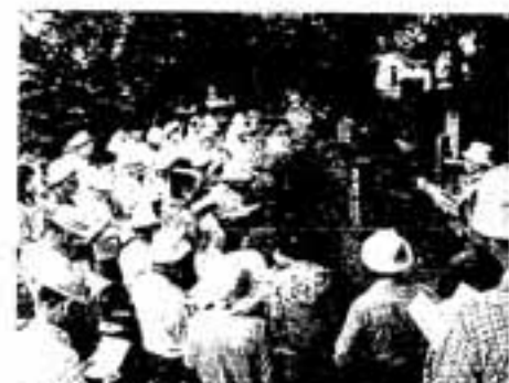
ここが有名な民本遺跡です

参加者は講師の説明に熱心に耳を傾けながらメモをとり、講師に疑問点を尋ねるなどして、雨にたたられることなく、約2時間の遺跡探訪を楽しみました。