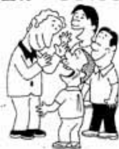
共に語ろう外文月間