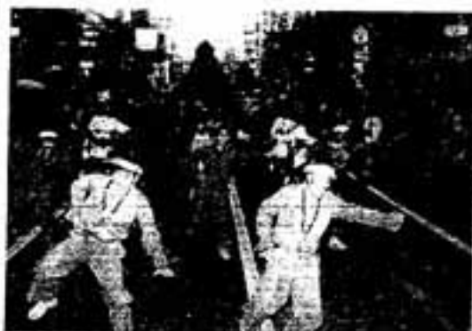
「気分はもう弥生人」