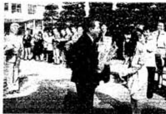
「4年間がんばってくださいね」

最後に、「市民が、春日市に住んでいて良かったと感動できる街づくりを目指したい」という言葉で、就任あいさつを締めくくりました。