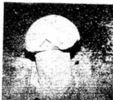
市内でただ一つの陽石

石造物は石の彫刻です。石造物にはさまざまな種類がありますが、形が強烈で特異なものとして陰陽石があります。陰陽石は、民間信仰の中で各地に見られますが、その形のためなかなか陽があたらないものでした。陰陽石は男女の性を表現しています。人々は、男女の性に不思議な力を感じ、子供の誕生に驚き、そしておそれおのき、転じて大地の豊饒と子孫繁栄などの信仰となったものと考えられます。このような信仰は、単純で土俗性が強いだけに