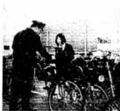
「ちゃんとカギをかけてね」

通勤、通学の利用者が多い西鉄春日原駅前で、4月23日(岡朝)春の防犯運動街頭キャンペーンが、筑紫野警察署や筑紫地区防犯協会の主催で行われました。 このため自転車などの盗難が多発しており、春日原駅周辺は、福岡県警察本部から盗犯防止重点地区に指定されています。 この不名誉な現状を改めようと、市や筑紫地区の防犯指導員の皆さんが、自転車などのカギかけやきれいな駐車と保管、防犯登録の指導などを道行く人々に訴えていました。