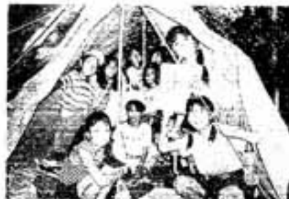
「キャンプたのしいよ」

市教育委員会では、キャンプ活動の理論と実技を通して指導者を養成するため、講習会を行います。 事前研修(講義)だけの参加もできます。皆さんの参加をお待ちしています。 期日