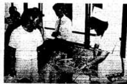
はい、手をにぎって

あなたに は、1ガン2心臓病 3脳卒中です。成人病なんて関係ないと強気でいても、身体は年々老いています。自分で気付かないうちに、病気が進行しているかもしれない。あなたの健康は、あなたのためばかりでなく、家族のためでもあります。年1回の健康チェック。ためらわず、めんどろがらずに受けてみてください。