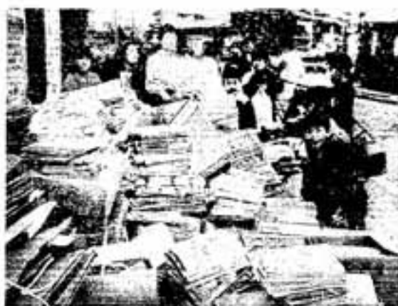
みんなも、ごみ減量に協力してね

私たちの生活の中から一日として休むことなく排出されるごみ、特に燃えるごみは、近年増え続け、市としても急増するごみの処理に頭を痛めています。 平成2年度1年間に市が回収したごみの量は、約2万3千トンで、その処理にかかった費用は、収集経費も含めて約6億7千万円になります。 これは、今年開校した春日野小学校の体育館が