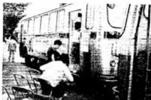
1年に1回は健康チェックを